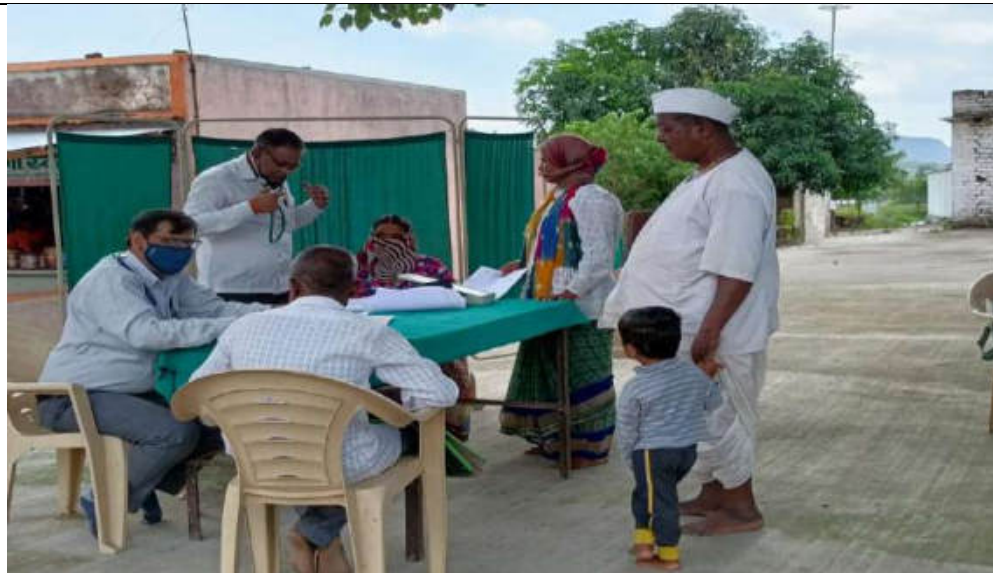
Helath Camps in Azadi ka Amrut Mahotsav 2021