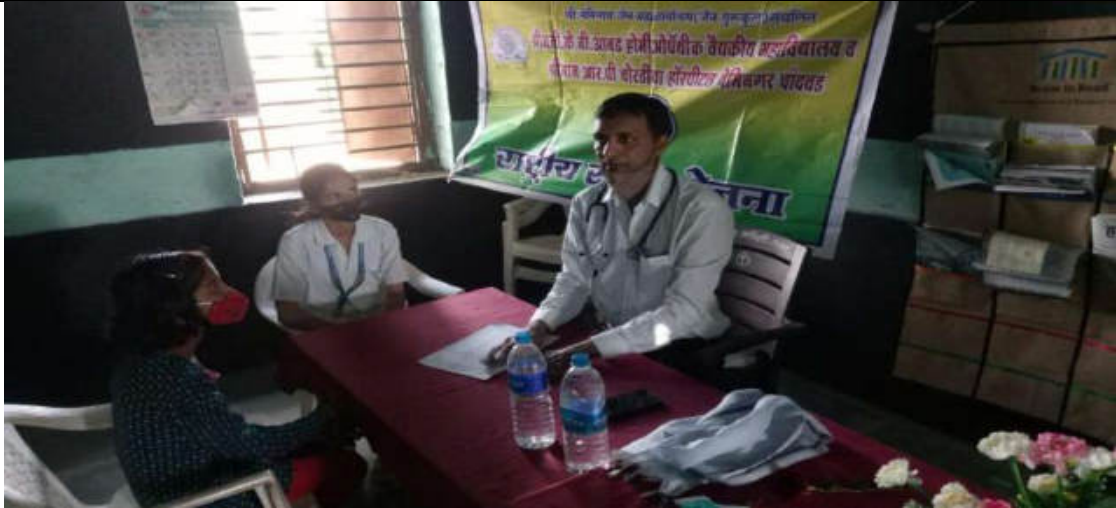
Helath check up of School childrens