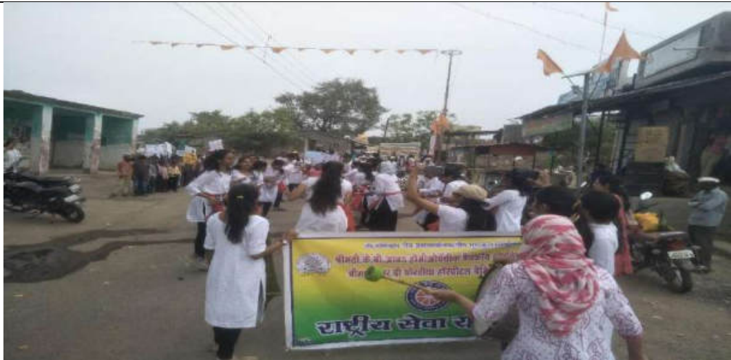
Street Play on Vaccination awareness