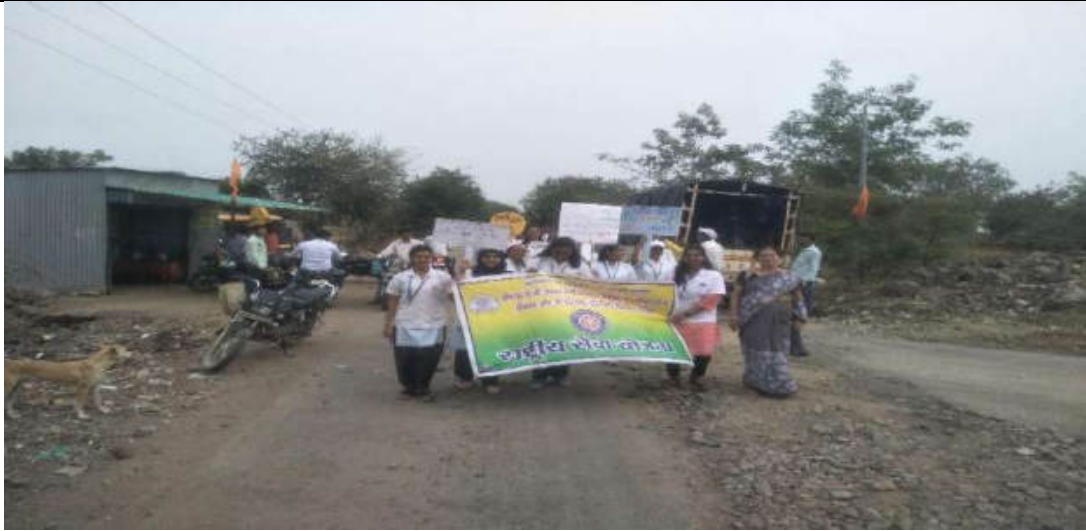
Homoeopathic Camp in Uswad Adaptive Village