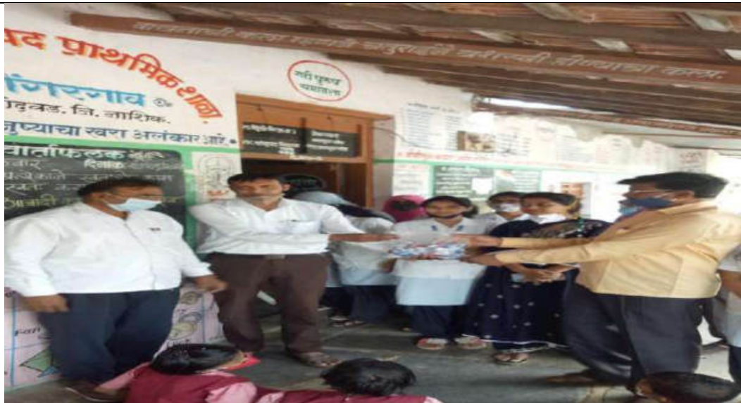
Fisrt Aid Kit given to School for Early Management of Prime issues