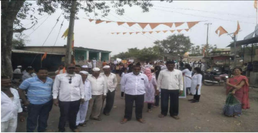
Street Play on Deaddiction