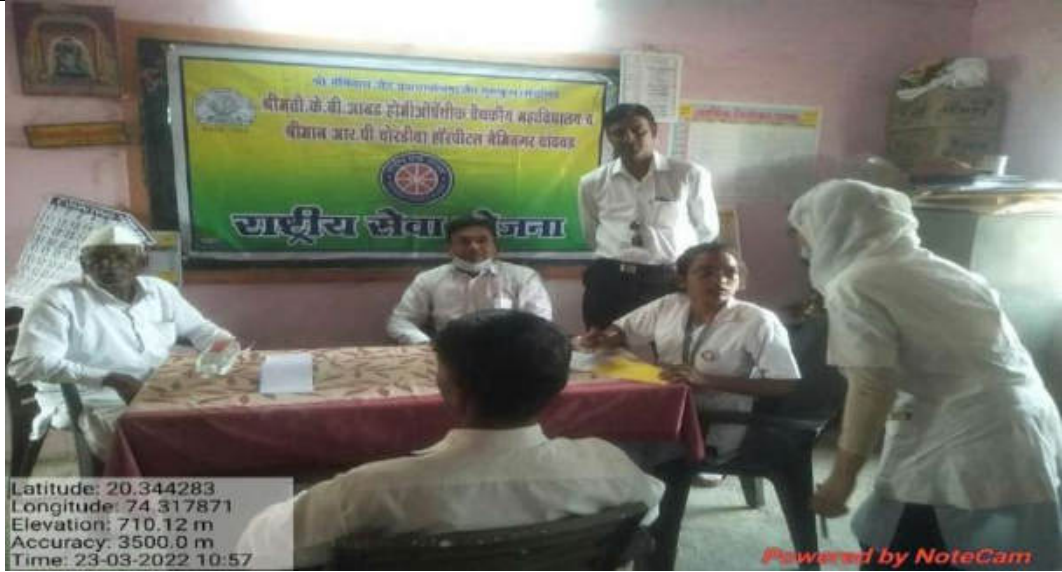
Swachata Awareness Rally