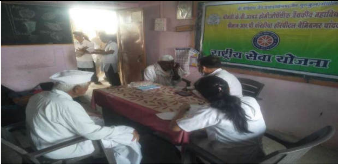
Helping Old Needy People in Uswad